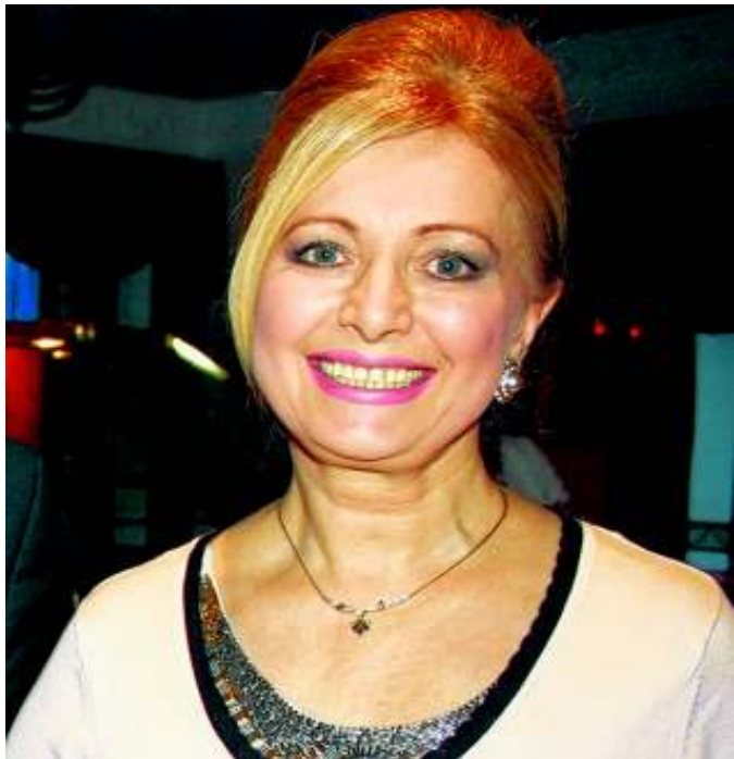
Maria Prinzessin von Sachsen-Altenburg liest beim Treffen des WBC aus ihrem Buch.